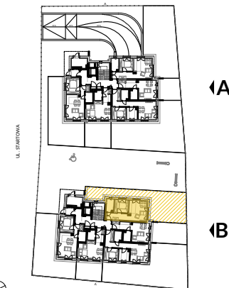
PARTER SCHEMAT - LOKALIZACJA MIESZKANIA

Powierzchnie pomieszczeń liczone wg normy PN-ISO 9836:1997