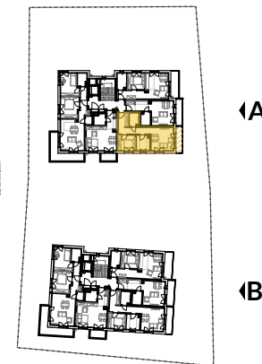
2 PIĘTRO SCHEMAT - LOKALIZACJA MIESZKANIA

Powierzchnie pomieszczeń liczone wg normy PN-ISO 9836:1997