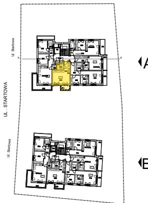
1 PIĘTRO SCHEMAT - LOKALIZACJA MIESZKANIA Powierzchnie pomieszczeń liczone wg normy PN-ISO 9836:1997