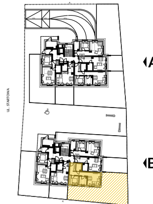
PARTER SCHEMAT - LOKALIZACJA MIESZKANIA Powierzchnie pomieszczeń liczone wg normy PN-ISO 9836:1997