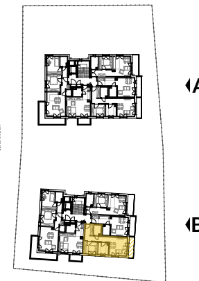
2 PIĘTRO SCHEMAT - LOKALIZACJA MIESZKANIA

Powierzchnie pomieszczeń liczone wg normy PN-ISO 9836:1997