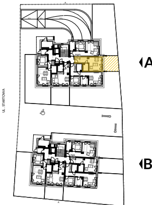
PARTER SCHEMAT - LOKALIZACJA MIESZKANIA

Powierzchnie pomieszczeń liczone wg normy PN-ISO 9836:1997