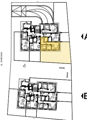
PARTER SCHEMAT - LOKALIZACJA MIESZKANIA

Powierzchnie pomieszczeń liczone wg normy PN-ISO 9836:1997