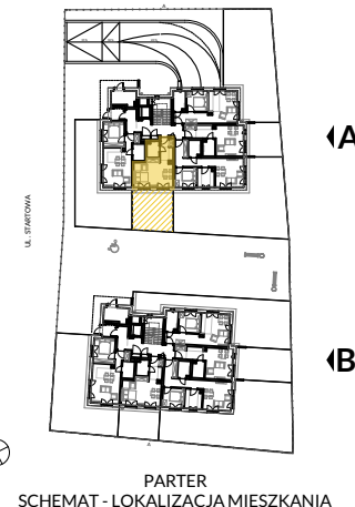
PARTER SCHEMAT - LOKALIZACJA MIESZKANIA

Powierzchnie pomieszczeń liczone wg normy PN-ISO 9836:1997