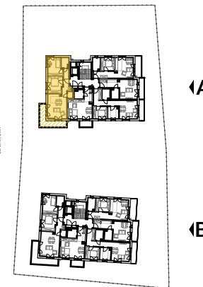
2 PIĘTRO SCHEMAT - LOKALIZACJA MIESZKANIA

Powierzchnie pomieszczeń liczone wg normy PN-ISO 9836:1997